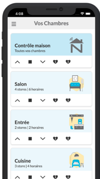
Contrôlez vos stores en groupe

Documentation en ligne et assistance technique par téléphone ou par e-mail.