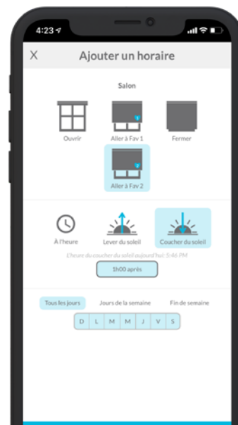
Créez des horaires pour vos chambres adaptés à votre routine